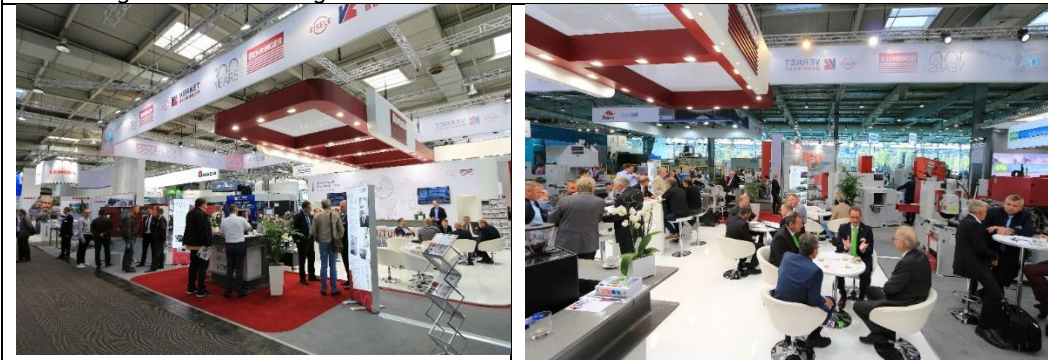
Messestand der Behringer-Gruppe auf der EMO 2019.