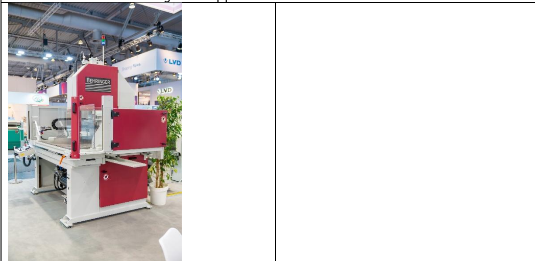
Automatische Tischbandsäge LPS-TA zum Trennen von kleinen Platten und Blöcken.